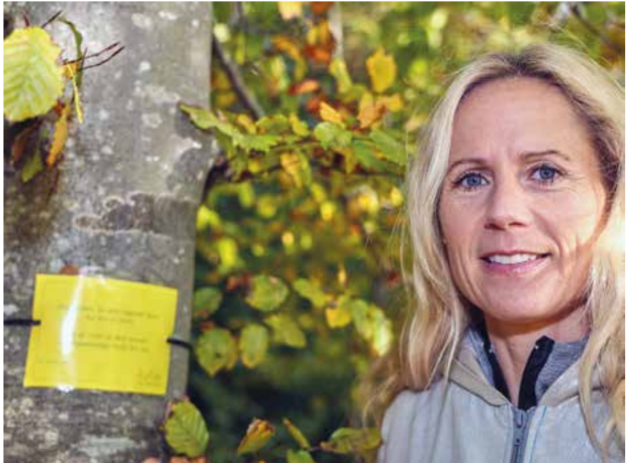
Alle, der går en tur på i Snetrup, kan fremover se de små skilte med visdomsord til eftertanke sat op på initiativ af Skovgruppen i menighedsrådet.

- At man skaber glæde for hinanden, samhørighed og tryghed, hilser på hinanden på sin vej, kan være alvorlige