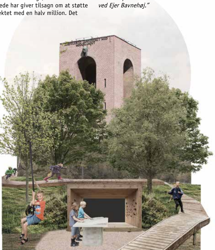
Skitseforslag fra LYTT Architecture

Hele det grønne område omkring Ejer Bavnehøj er fredet efter naturbeskyttelsesloven. Vi har derfor spurgt Fredningsnævnet, om ideerne er i overensstemmelse med en omfattende fredning fra 2006. Efter en besigtigelse i oktober skriver Fredningsnævnet: "Der er grundlag for at arbejde videre med skitseprojektet, som findes at være et godt projekt, som ikke er i modstrid med hverken fredningens formål eller fredningens bestemmelser. Fredningsnævnet skal dog til sin tid konkret godkende projektet og dets delelementer særligt i lyset af, at de ikke må være 'larmende' og påkalde sig for stor opmærksomhed i landskabet ved Ejer Bavnehøj."