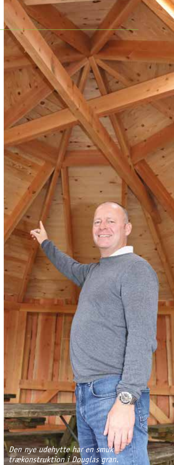
Den nye udehytte har en smuk trækonstruktion i Douglas gran.

- Indlæring fungerer nemlig bedre ved at arbejde med projekter, hvor forskellige fag kobles sammen, og hvor eleverne selv skal tage initiativ, fortæller han.